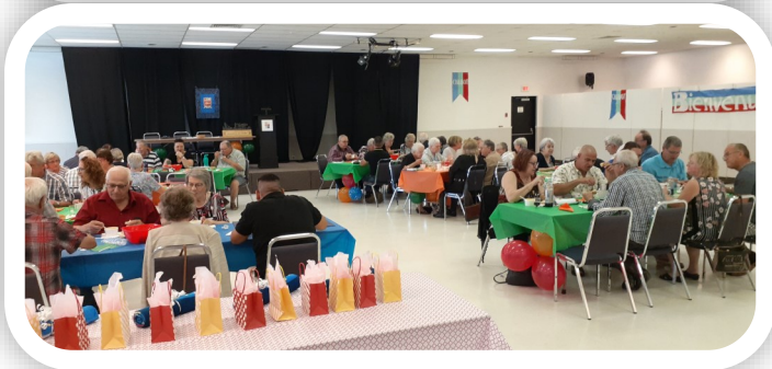
Voir à votre gauche, trois photos des participants de la journée du 15e anniversaire de l'association