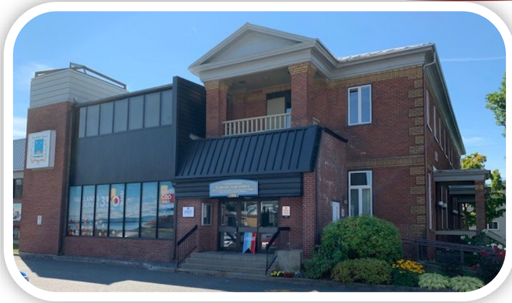
Centre culturel de Cap-Saint-Ignace où se situe la Salle Léandre Boutin