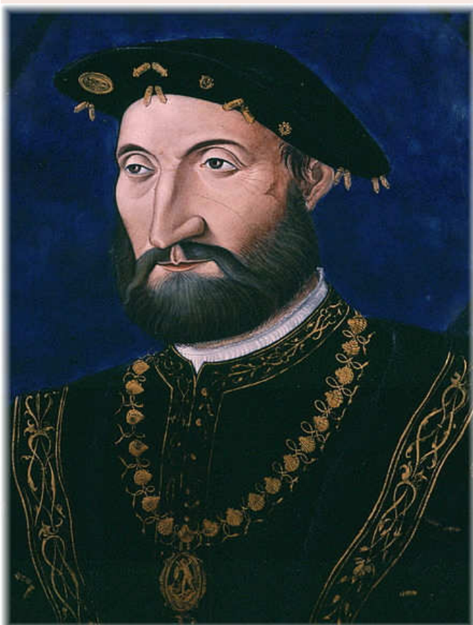
Guy Chabot, baron de Jarnac

Après d'interminables préparatifs et un long cérémonial, les adversaires s'affrontèrent. Lors d'une attaque de François de Vivonne, Jarnac frappa un coup du revers de son épée qui fendit le jarret de son adversaire. Les uns disent qu'il y eut un coup au jarret de la jambe gauche et un autre au jarret de la droite. François de Vivonne s'écroula et ne se releva pas.